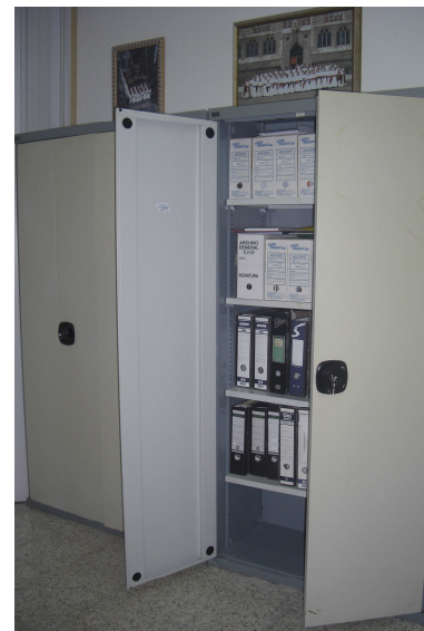
Armarios que albergan el Archivo

Esta columna, Archivum , servirá de medio para difundir algunos de los documentos que forman parte de este Archivo Documental.