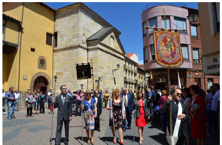
Una representación de la Hermandad en Procesión del Corpus Chico.

Seguidamente, tuvo lugar una Procesión sacramental que recorrió las naves catedralicias con la asistencia de varias Cofradías eucarísticas de la Diócesis.