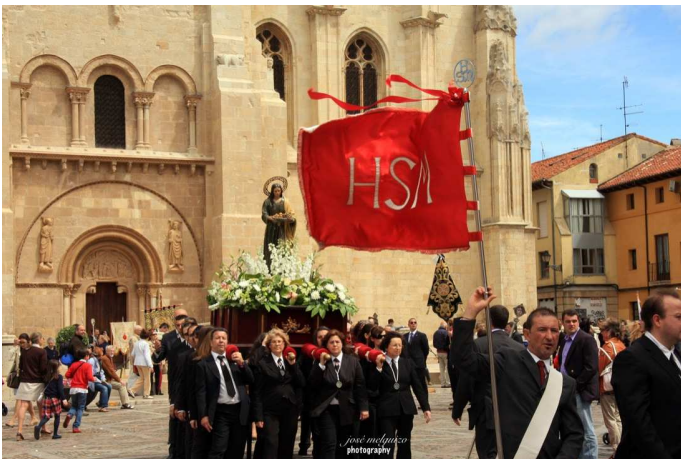
La Procesión a su paso por San Isidoro.

El domingo 10 de junio, solemnidad del Santísimo Cuerpo y Sangre de Cristo, nuestra Hermandad asistió, como es tradicional y preceptúan nuestros Estatutos, a la Procesión del Corpus que organiza el Cabildo Catedral.